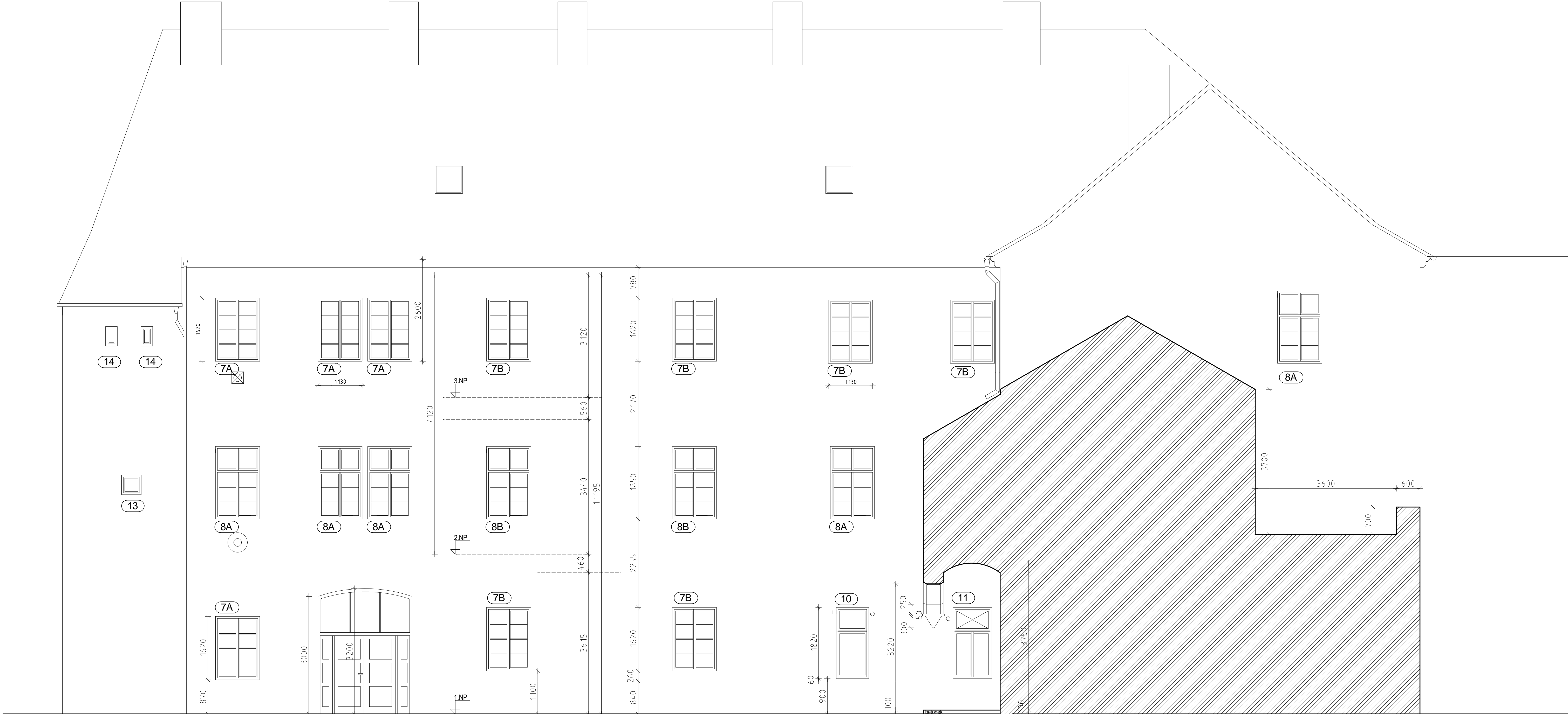
POHLED "H" - NA SEVERNÍ KŘÍDLO ZE DVORA